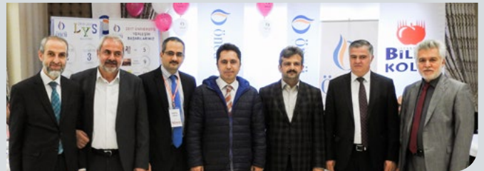
Üyelerimiz Mini Fuar'da bir araya geldi