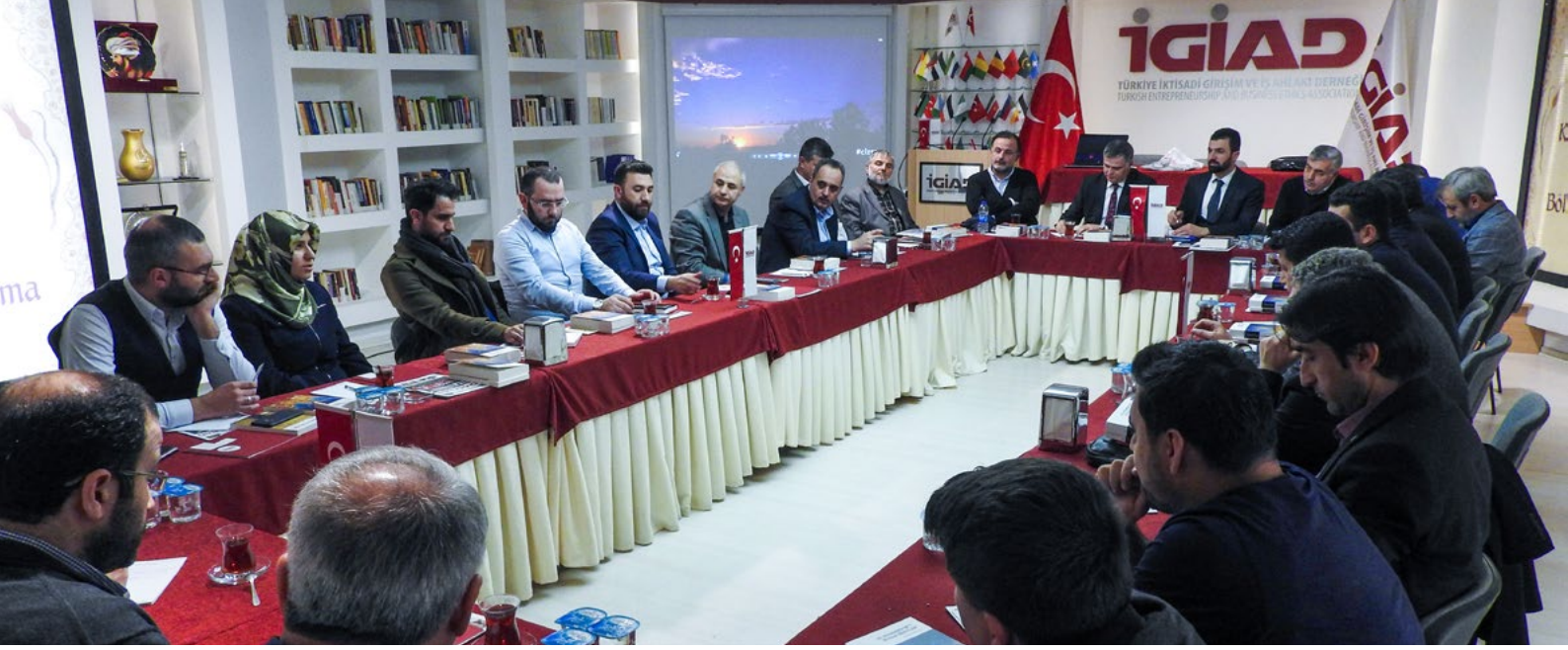
Sırnak ve Cizreli iş adamlarının derneğimizi ziyareti. 27.12.2017