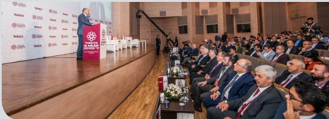
Türkiye, İş Ahlâkı Zirvesi'nde bulundu