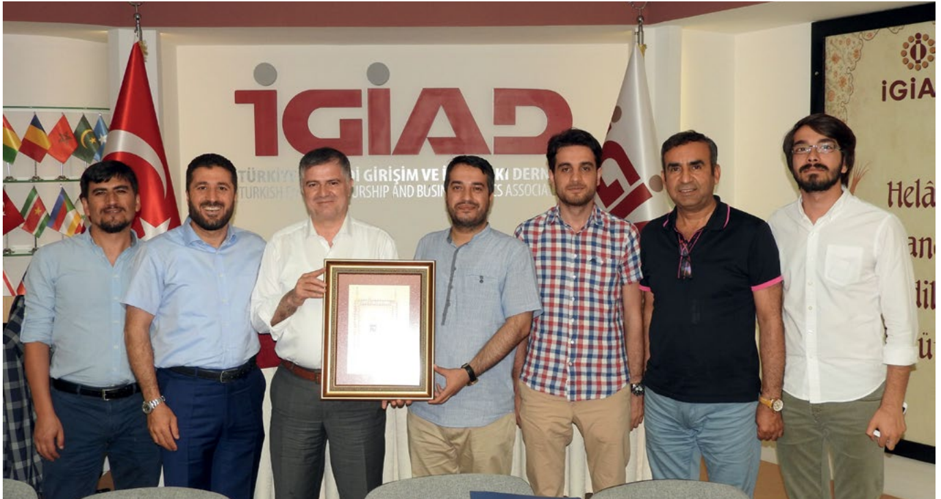
İLEM İlmî Etüdler Derneği'nin İGİAD'ı ziyareti 26.07.2017