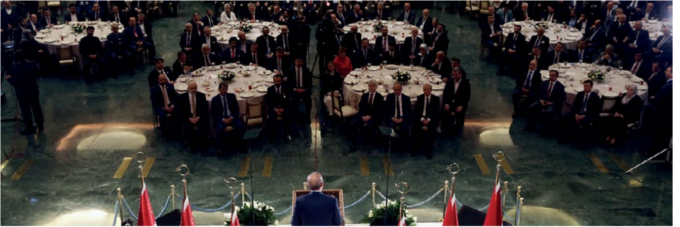
Cumhurbaşkanlığı Külliyesinde STK temsilcilerine verilen iftarda İGİAD'ı temsil ettik. 21.06.2017