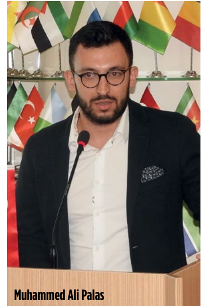
Muhammed Ali Palas