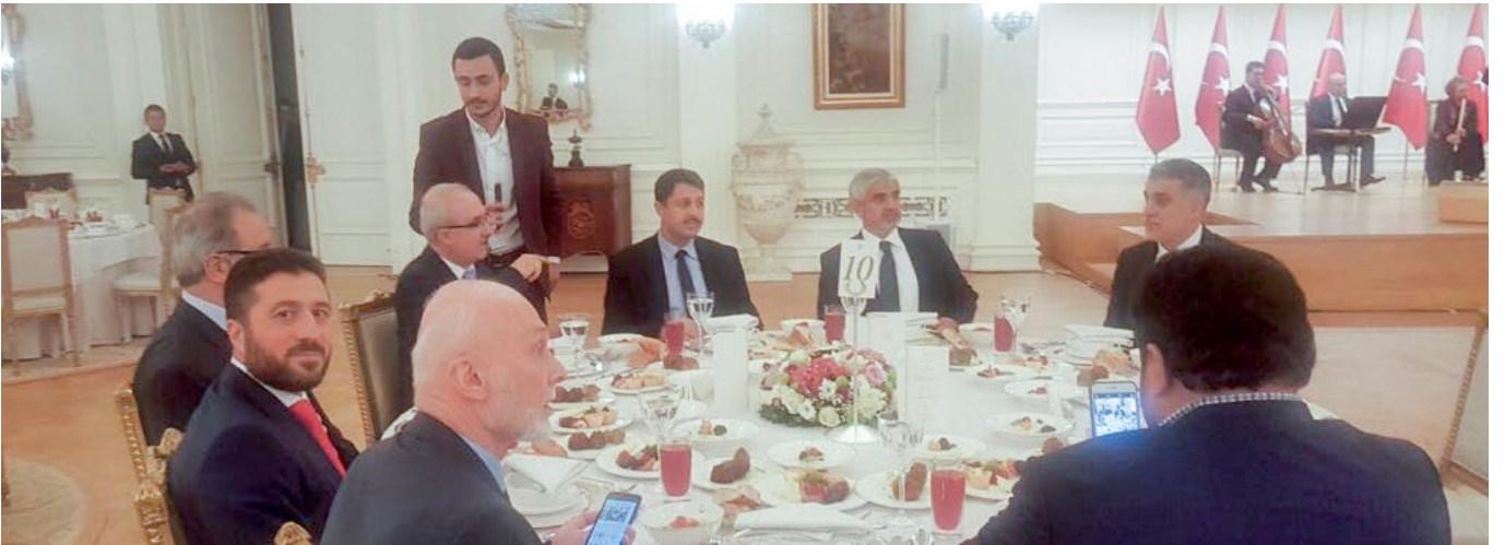
Çankaya Köşkü'nde Başbakan Binali Yıldırım'ın evsahipliğinde STK temsilcilerine verilen iftardayız. 07.06.2017