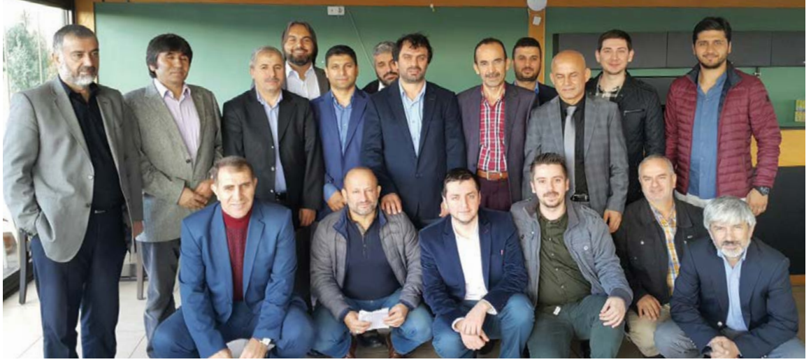
Bölgesel Tanışma Toplantısı, 31.10.2015