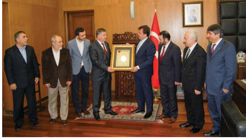
Belediye Başkanı Fatih Mehmet Erkoç