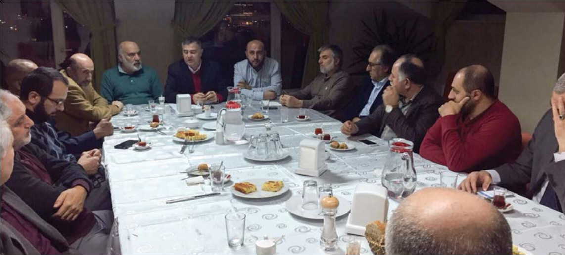
Anadolu Yakası Bölgesel Tanışma Toplantısı, 16.12.2015