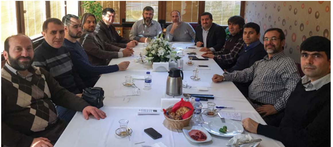
Bölgesel Tanışma Toplantısı, 19.12.2015